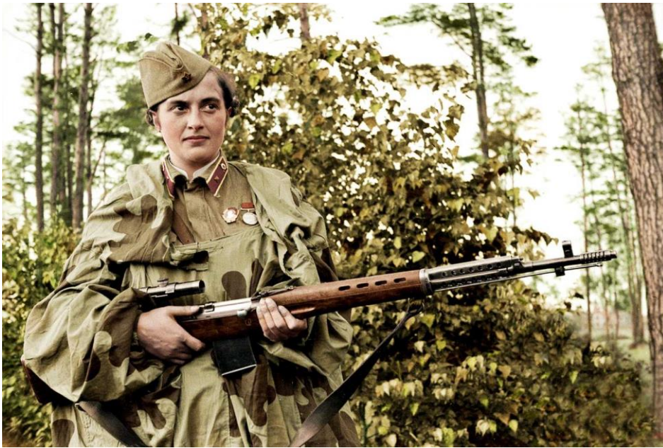
Людмила Павличенко. 1942 г.