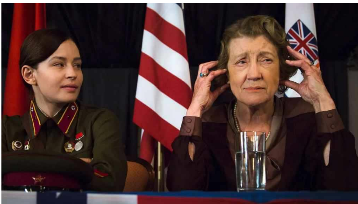
Людмила Павличенко и Элеонора Рузвельт (актриса Джоан Блэкхэм) Кадр из кинофильма «Битва за Севастополь». 2015 г.