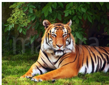
рисунок превосходно скрывает тигра в бамбуковых зарослях и в высокой траве.

ВОПРОС: Зачем же им полосы, если они легко могут «разобраться» с любой добычей?